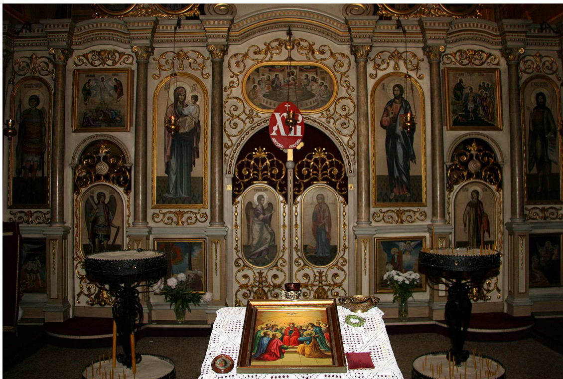
иконостас оснабричког храма

од културног значаја, како архитектонског тако и историјског, са датумом од 07. 10. 1980. године.